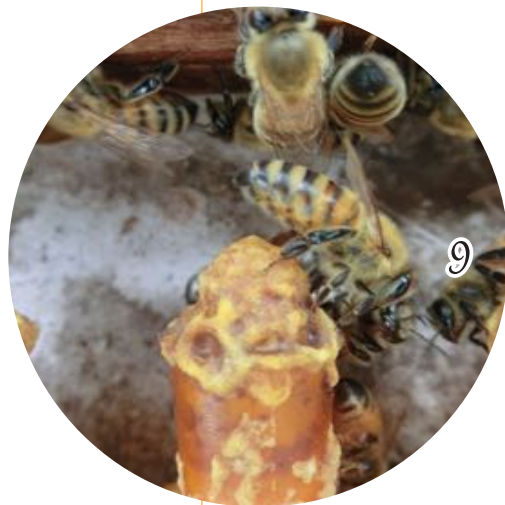
8... 働きバチに囲まれる女王バチ

人工王台に移虫をし、普通は3日目にローヤルゼリーを採乳していますが、そのまま10日間ほど巣箱に入れておくと、たくさん女王バチが生まれます。一つの巣箱に女王バチは1匹だけなので、羽化する前に別の巣箱に移さなければ、複数匹が羽化するとお互いに傷つけ合ってしまう。女王バチの体の色が黒くなってきたら年老いた合図で、産卵も減ってきます。