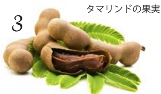
タマリンドの果実

(※1) タマリンドについて 甘酸っぱいタマリンド。酸味には疲労回復効果や整腸作用の高い成分が含まれており、昔から民間薬として重宝されてきました。